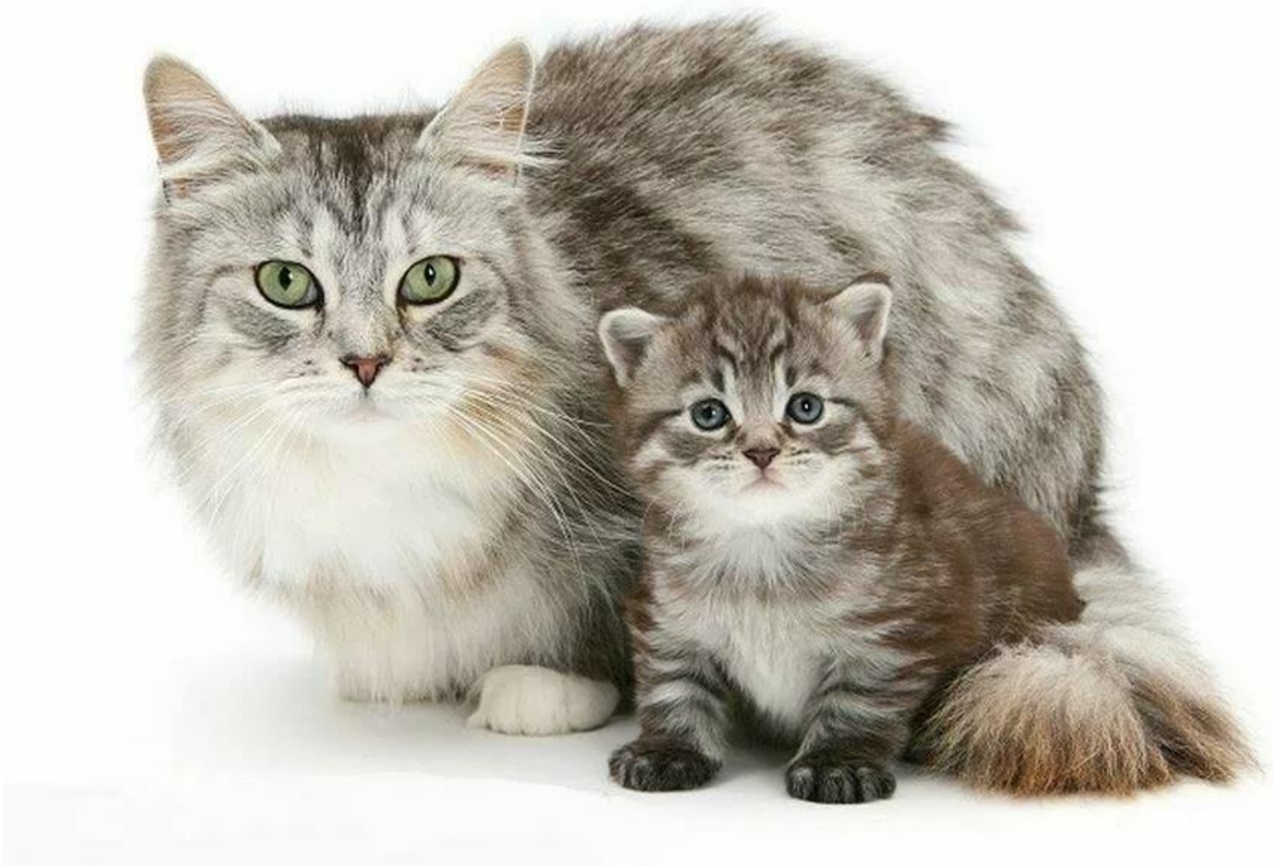
Кошка и котёнок